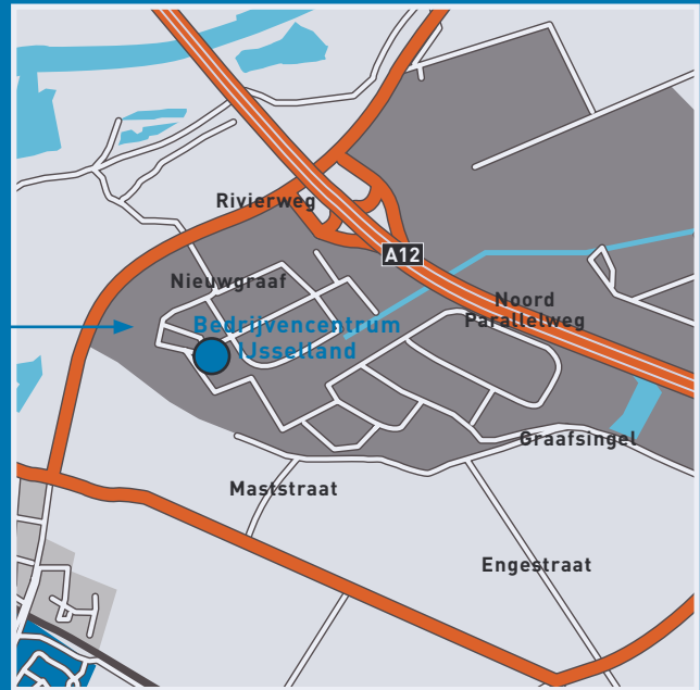
DIJKGRAAF 11 T/M 19 EN FOTOGRAAF 30 T/M 40